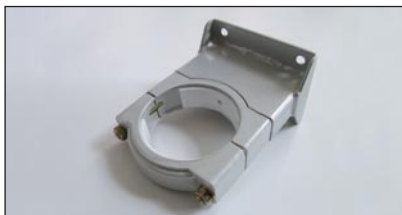
obere Befestigung mit Lager