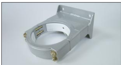
obere Befestigung mit Lager