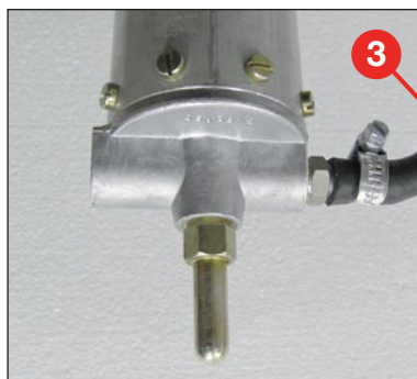
Zapfen am Mastfuss für schnelle und einfache Befestigung am Dreibeinstativ oder Fahrzeug-Anbauset