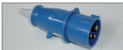
Typ CEE17 Farbe : Blau Kat. Nr. B11861

Empfohlene Stecker für 230 Volt Installation