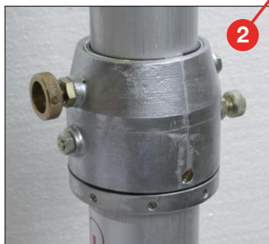
verstellbarer Drehkragen, standard farblos anodisierte, nahtlos gezogene, Aluminiumrohre mit \text{\O} 2\frac{1}{2} " (63,5 mm) Basisrohr