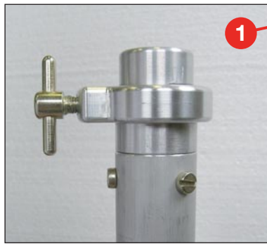
24 mm Klemmsystem