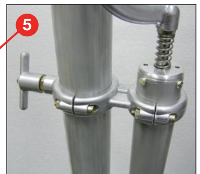
Handpumpe und Knebelschraube für schnelle und einfache Befestigung am Dreibeinstativ oder Fahrzeug-Anbauset