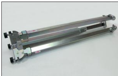
Ausführung Dreibeinastativ: Edelstahl

Dieses sehr stabile Dreibeinastativ lässt sich vertikal zusammen klappen und kann leicht getragen und verstaut werden. Alle MK VI Dreibeinastative können sowohl vertikal als auch horizontal verstaut werden.