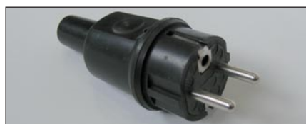
Schuko Vollgummistecker mit zusätzlicher Erdung Kat. Nr. B11619