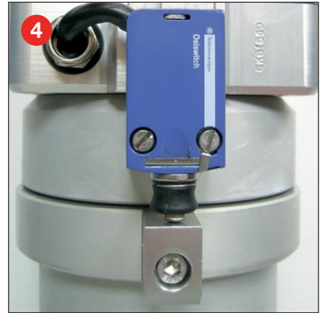
4 Standard angebauter und verkabelter Mastausfahrwarnschalter