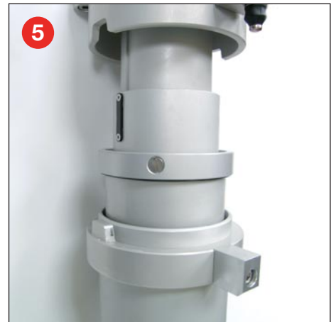
5 Abdeckung zum Schutz der nutengeführten Mastrohre