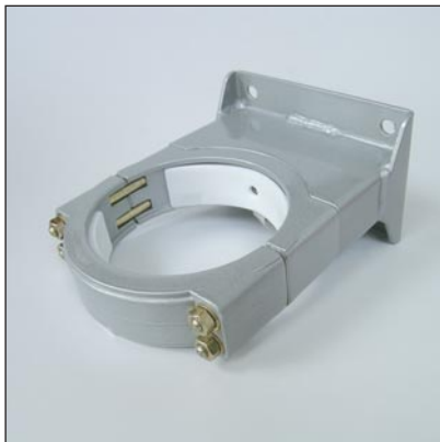
obere Befestigung mit Lager