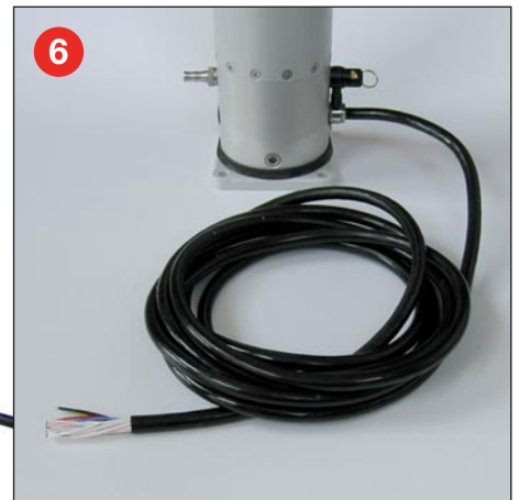
6 Stromversorgungskabel (5 Meter) mit nummerierten Adern für Leuchten/ Rundumkennleuchte