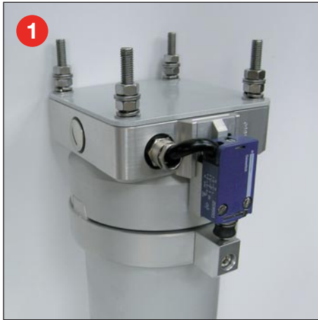
1 Mastkopf Montage mit 4 x PG13,5 Kabelverschraubungen ausgestattet mit nutengeführten Mastrohren