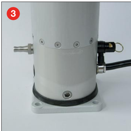
3 Feste Kardan-Basis mit Luftanschluss und Sicherheitsventil für manuelle Entwässerung